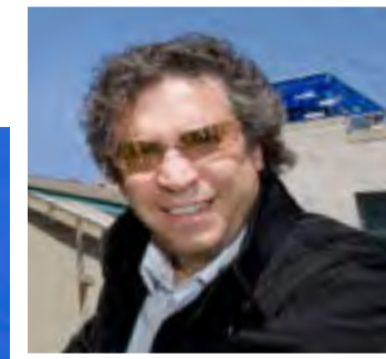
Le concepteur et créateur Franco Dragone

Source : Musée de la civilisation, Service de la recherche et de l'évaluation, Enquête générale été 2008, année des célébrations du 400 e anniversaire de la ville de Québec.