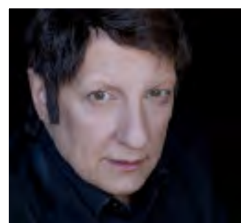
Le concepteur et créateur Robert Lepage

600 000 entrées aux portes par année et plus de 13 millions de visiteurs depuis son ouverture.