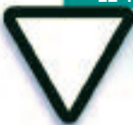
LE TRIANGLE RENVERSÉ